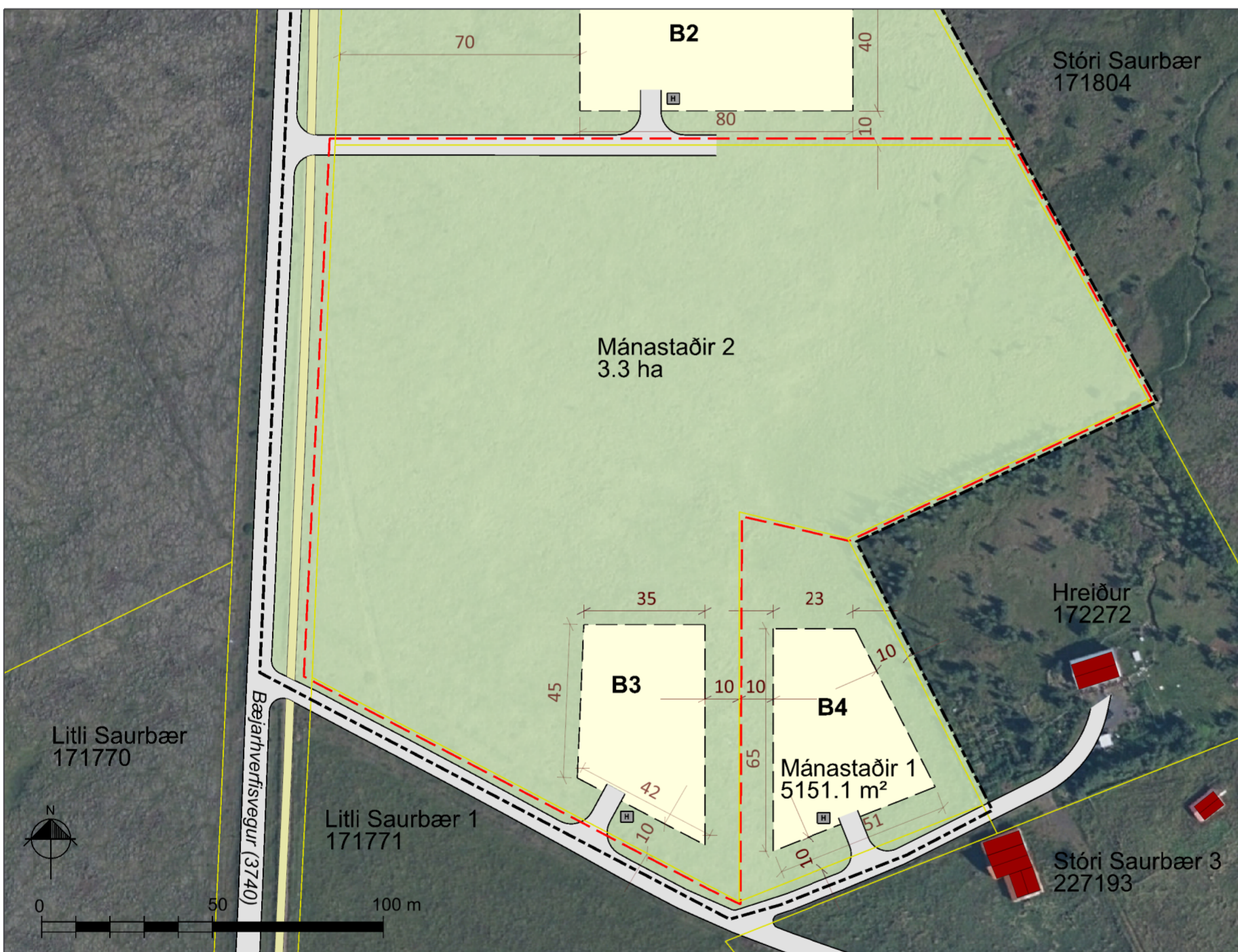
Hluti gildandi deiliskipulagsuppráttar í msk. 1:1500. Tók gildi 12.06. 2020.

Greinargerð Deiliskipulag Mánastaða 1, Mánastaða 2 og Kambastaða í Sveitarfélaginu Ölfusi var samþykkt í sveitarstjórn 27. ágúst 2019 og tók gildi með birtingu auglýsingar þar um í B-deild Stjórnartíðinda þann 12. júní 2020. Í Aðalskipulagi Sveitarfélagsins Ölfuss 2010-2022 er svæðið skilgreint landbúnaðarsvæði. Þar kemur m.a. fram að heimilt er að byggja frístundahús og íbúðarhús, sem ekki tengjast búrekstri á landbúnaðarsvæðum bújarða, án þess að breyta þurfi aðalskipulagi og fer fjöldi húsa eftir stærð lands. Á landspildum sem eru 0,5 - 3,0 ha að stærð er heimilt að byggja íbúðarhús, gestahús og bílskúr í samræmi við nýtingarhlutfall sem er 0,05.