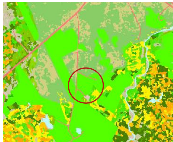
MYND 3. Vistgerðir (kortasjá Náttúrufræðistofnunar Íslands)