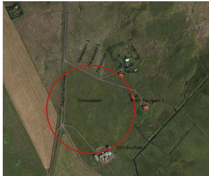
MYND 1. Yfirlitsmynd af svæðinu. Svæðið afmarkað með rauðum hring (Map.is)

Dimmstaðir er stofnuð úr landi Litla-Saurbæjar 1 (L171771) og er um 2,5 ha að stærð. Svæðið er nokkuð sunnan Hveragerðis, um 1 km austan við Þolákshafnarveg (nr. 38), sem liggur frá Hveragerði á Þrengslaveg, skammt norðan Þolákshafnar. Spildan er á skilgreindu landbúnaðarlandi, land flatlent, og grasi gróið.