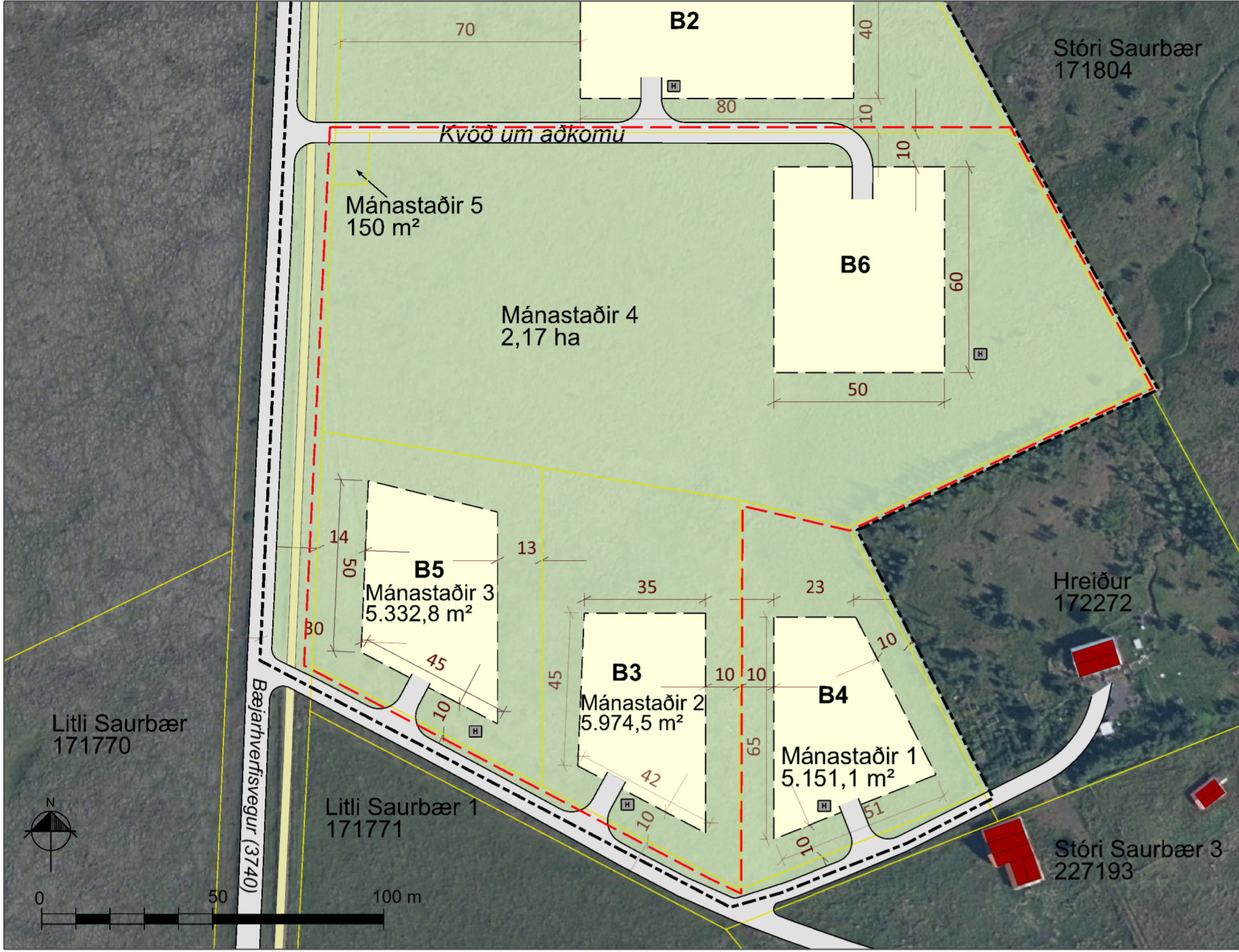
Breyttur deiliskipulagsuppráttur í msk. 1: 1.500