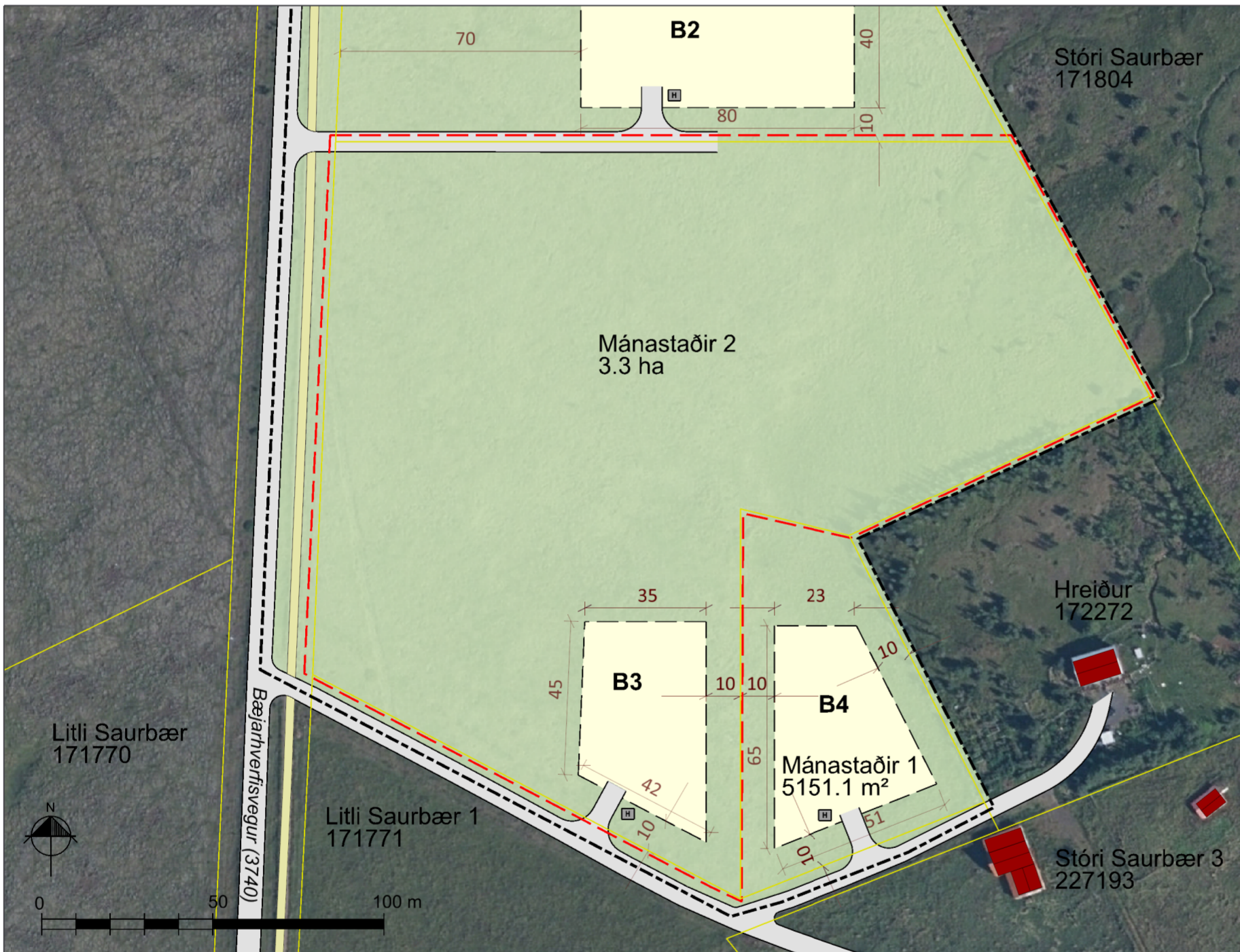
Gildandi deiliskipulagsuppráttur í msk. 1:1500. Tók gildi 12.06. 2020.

Greinargerð Deiliskipulag Mánastaða 1, Mánastaða 2 og Kambastaða í Sveitarfélaginu Ölfusi var samþykkt í sveitarstjórn 27. ágúst 2019 og tók gildi með birtingu auglýsingar þar um í B-deild Stjórnartíðinda þann 12. júní 2020. Í Aðalskipulagi Sveitarfélagsins Ölfuss 2010-2022 er svæðið skilgreint landbúnaðarsvæði. Þar kemur m.a. fram að heimilt er að byggja frístundahús og íbúðarhús, sem ekki tengjast búrekstri á landbúnaðarsvæðum bújarða, án þess að breyta þurfi aðalskipulagi og fer fjöldi húsa eftir stærð lands. Á landspildum sem eru 0,5 - 3,0 ha að stærð er heimilt að byggja íbúðarhús, gestahús og bílskúr í samræmi við nýtingarhlutfall sem er 0,05.