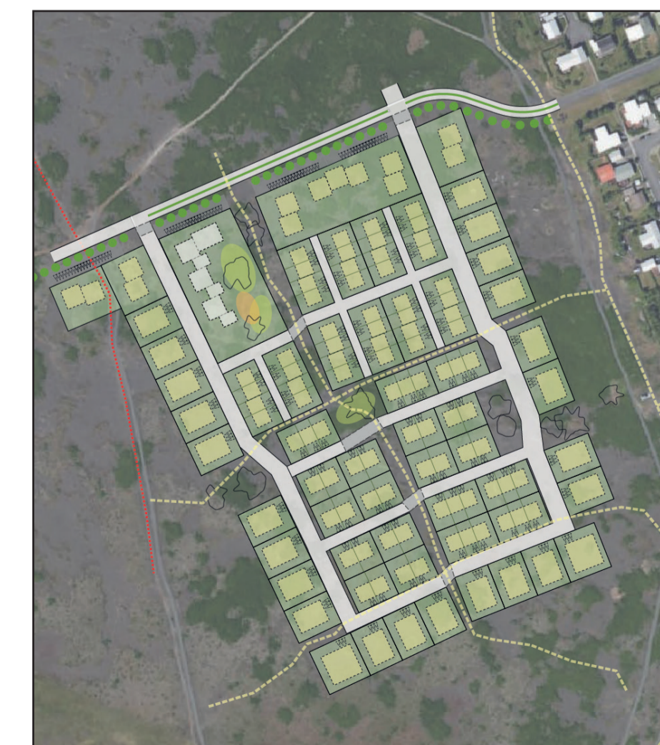
Ekki í skala

Yfirlitsmynd þessi sýnir hugmyndarfræði nýs hverfis þegar það telst fullbyggt í tveimur áföngum. Hanna þarf síðari áfanga hverfisins sérstaklega og samþykka stækkun og breytingu í samræmi við skipulagslög nr. 123/2010. Skýringarmynd er ekki nákvæm né bindandi þegar kemur að frekari hönnun.