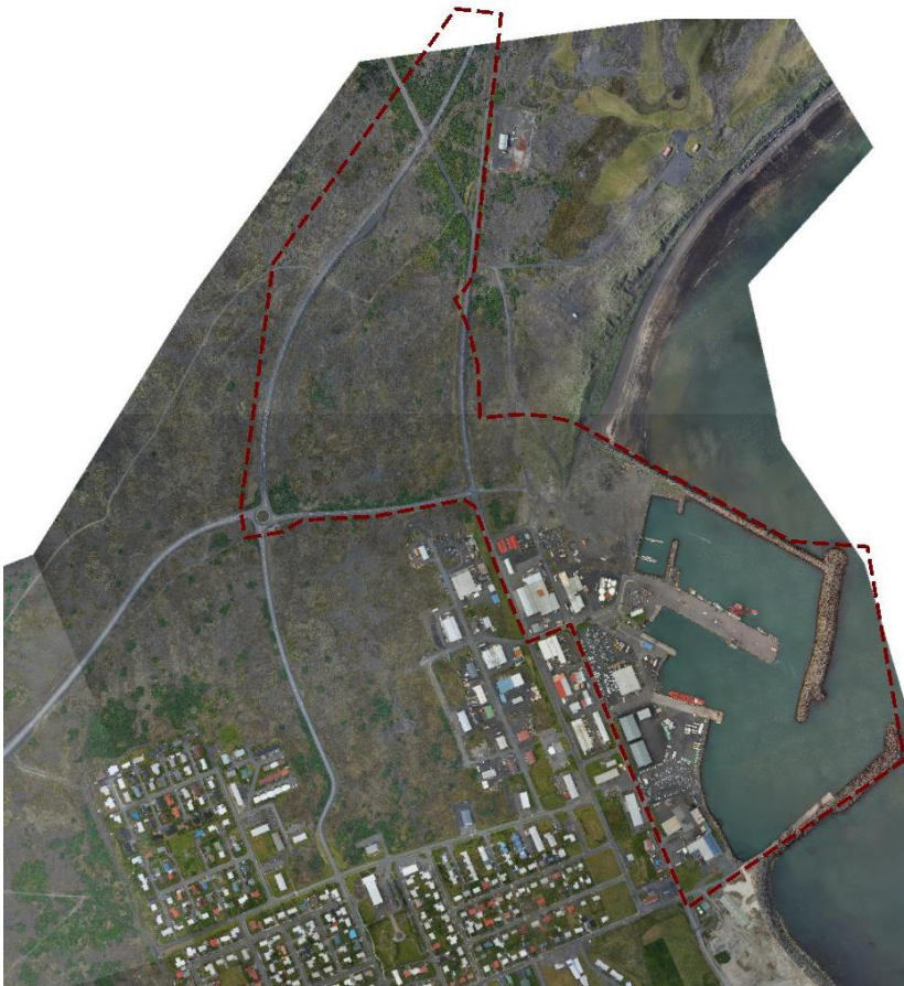
MYND 1. Sjá má afmörkun skipulagssvæðisins með rauðri brotinni línu.

Ráðgjafar við skipulagsvinnuna eru Steinholt ehf og EFLA verkfræðistofa.