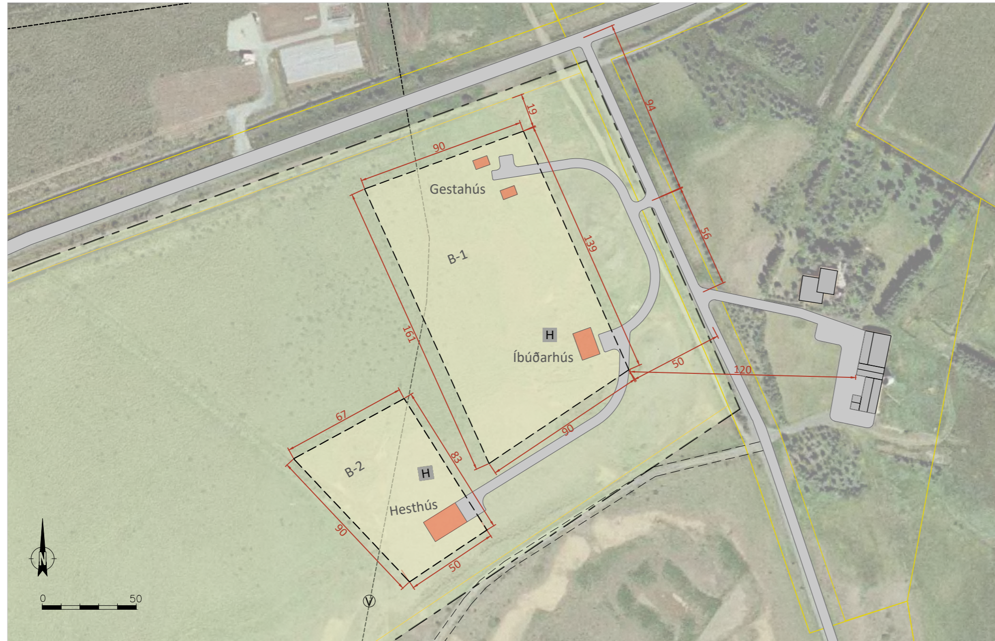
Deiliskipulagsuppráttur í mkv. 1:2000