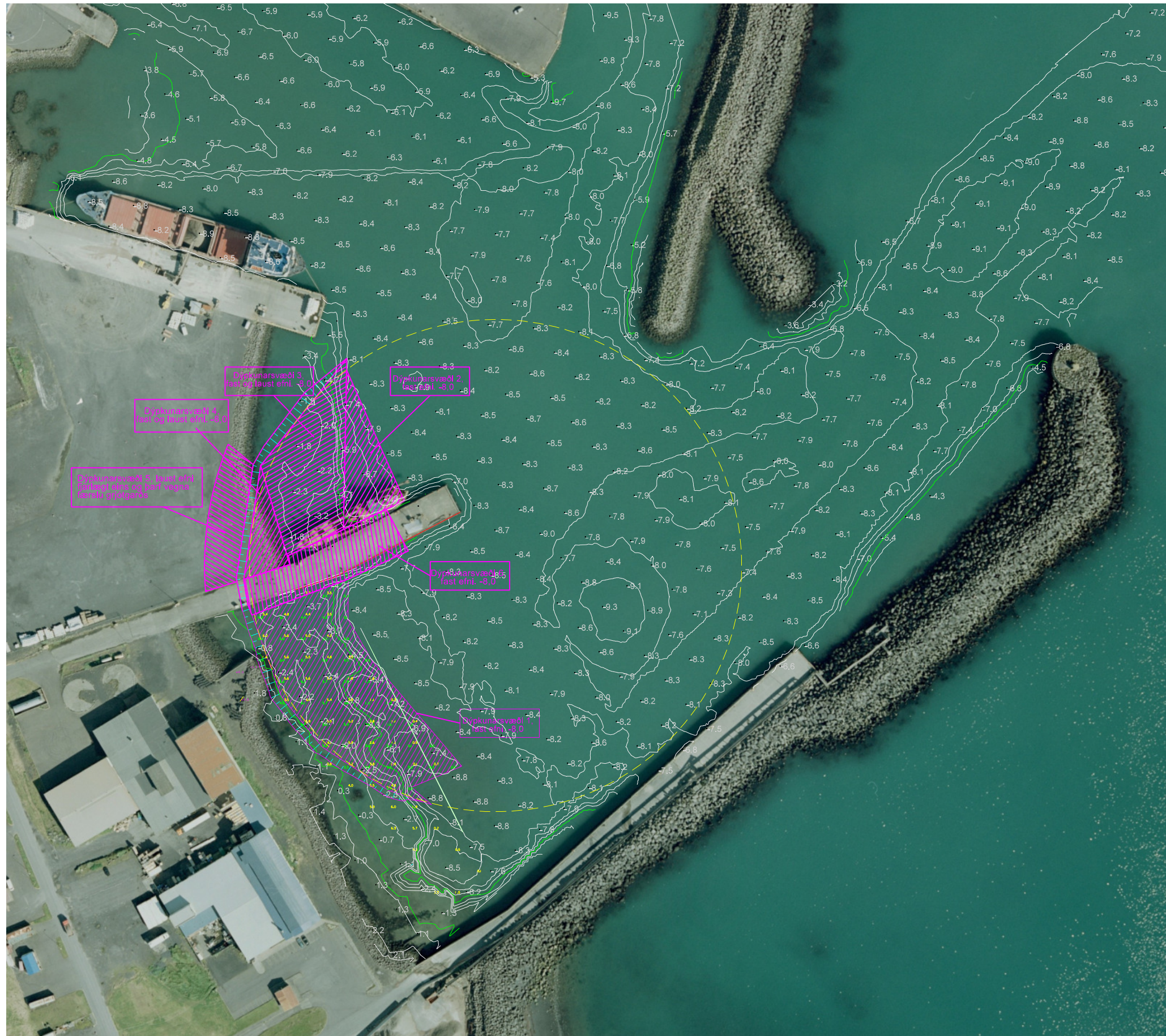
KENNISSNIÐ 1:100 ef laust efni