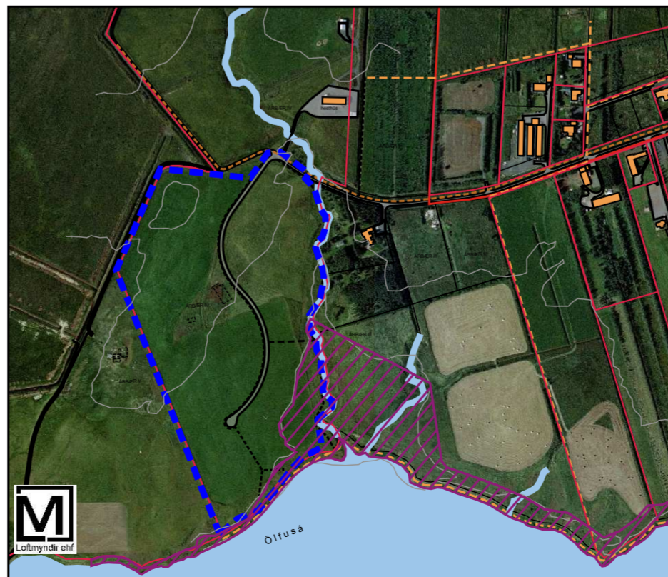
Yfirlitsmynd ekki í kvarða

Deiliskipulag þetta sem auglýst hefur verið skv.