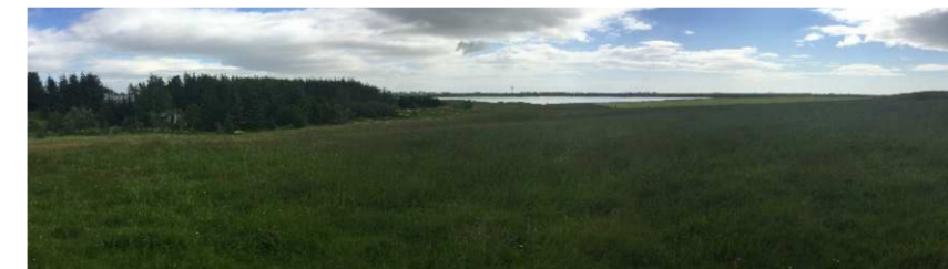
Mynd 01, horft til suðausturs frá lóð nr. 3 í átt að Selfoss/Ölfusá. Lækjartún t.v.