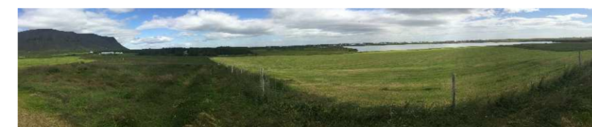
Mynd 02, horft til Ingólfsfjalls og til austurs frá bæjarhól í átt að Selfossi/Ölfusá