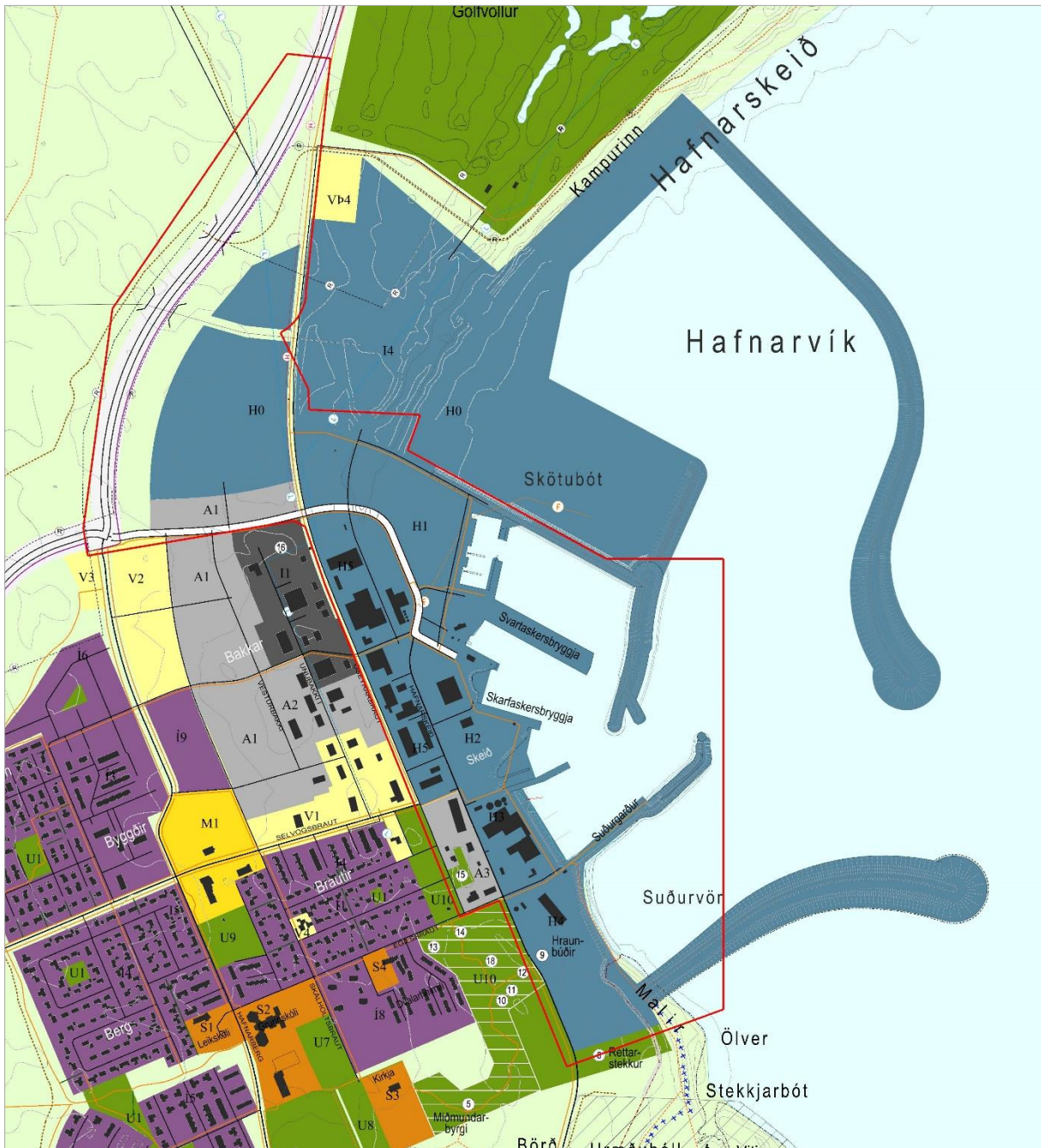
MYND 2. Aðalskipulag Sveitarfélagsins Ölfuss 2010-2022, þéttbýlisuppráttur Þorlákshöfn. Rauði ramminn sýnir það svæði sem að aðalskipulagsbreytingin nær yfir.

Skipulagsgerð sveitarfélaga stuðli að uppbyggingu atvinnulífs til framtíðar, með áherslu á gæði í hinu byggða umhverfi og öflugum innviðum. Sérstaklega verði hugað að fjölbreytni atvinnulífs með tilliti til þols gagnvart samfélags- og umhverfisbreytingum.“