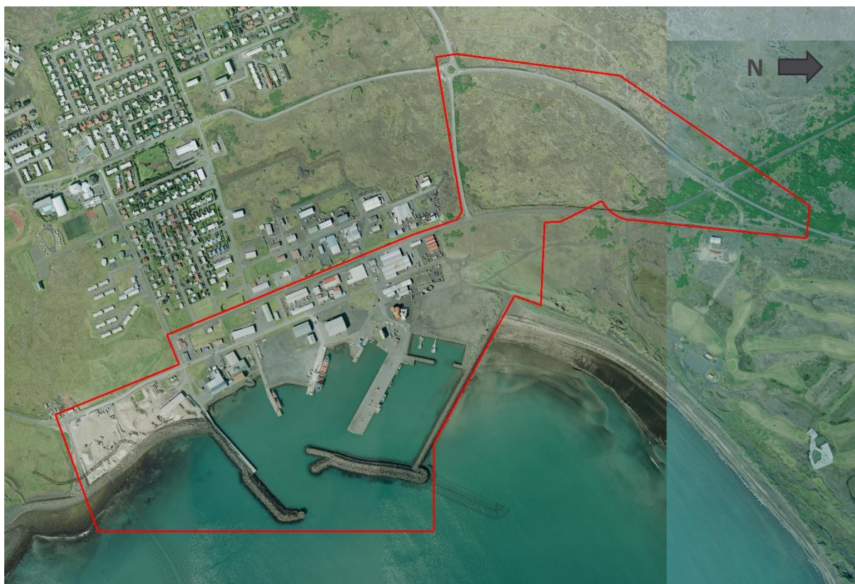
MYND 1. Sjá má afmörkun skipulagssvæðisins með rauðri línu.

Ráðgjafar við skipulagsvinnuna eru Steinsholt ehf og EFLA verkfræðistofa.