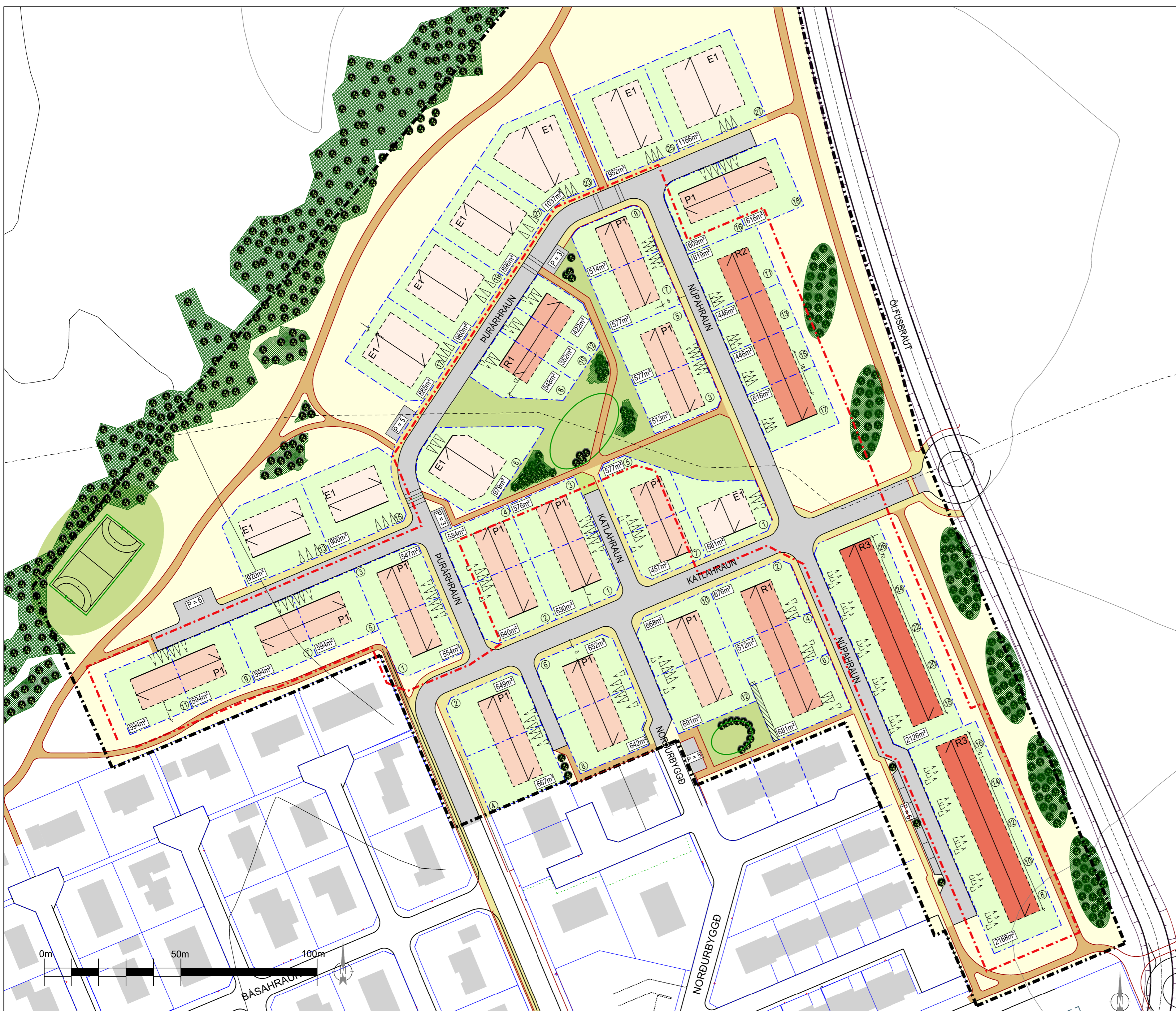
Tillaga að nýju deiliskipulagi, apríl 2017, mkv. 1:1000

Deiliskipulagsbreyting þessi sem fengið hefur meðferð í samræmi við ákvæði 1. mgr. 43. gr. skipulagslaga nr. 123/2010 var samþykkt í þann _____ 20__ og í þann _____ 20__.