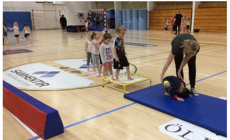
Nálægð við íþróttamiðstöð