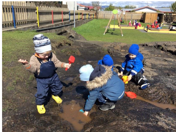
Útileiksvæðið býður upp á mikla möguleika fyrir hreyfingu